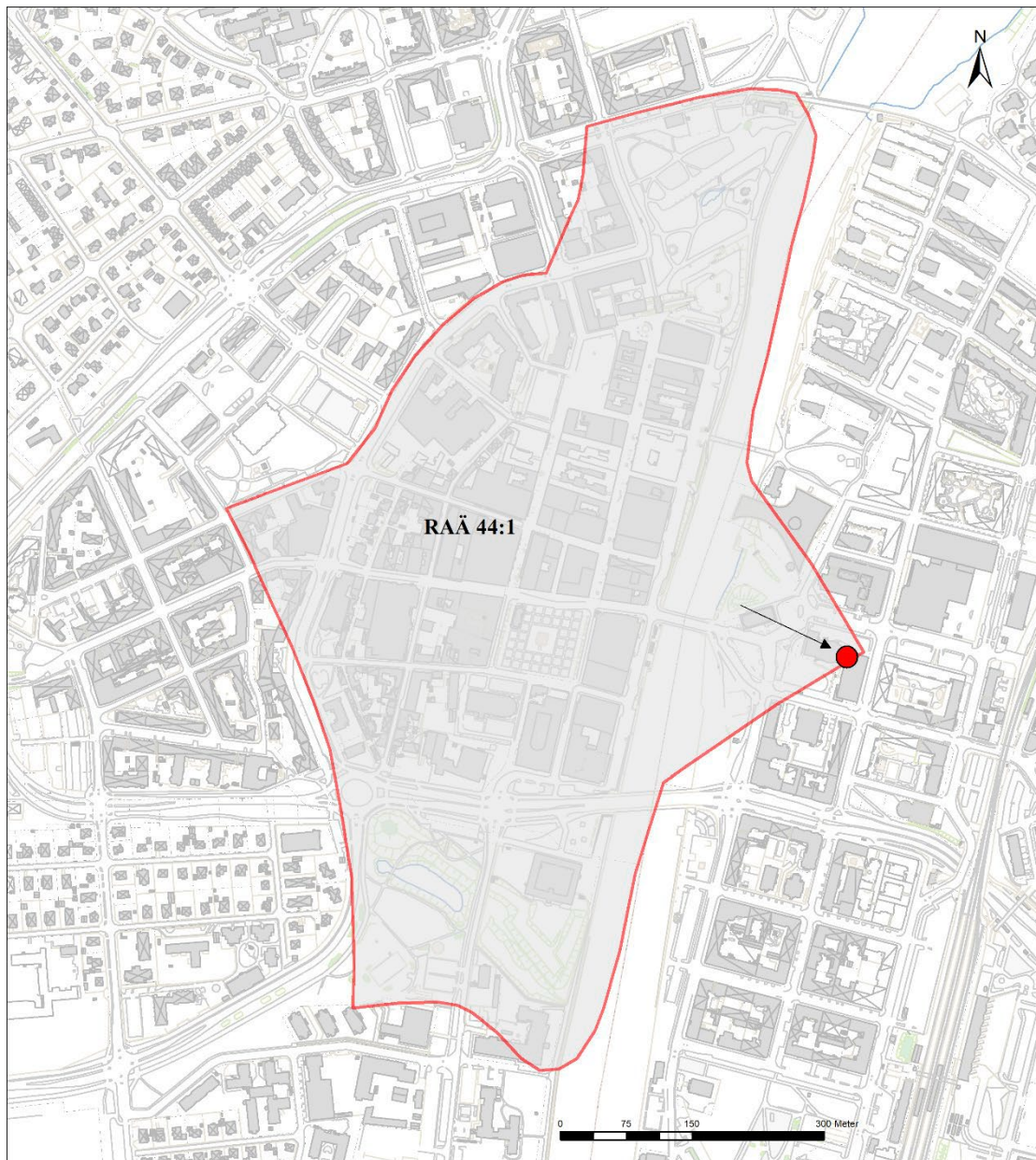
Figur 1. Undersökningsområdet. Skala 1:5000.