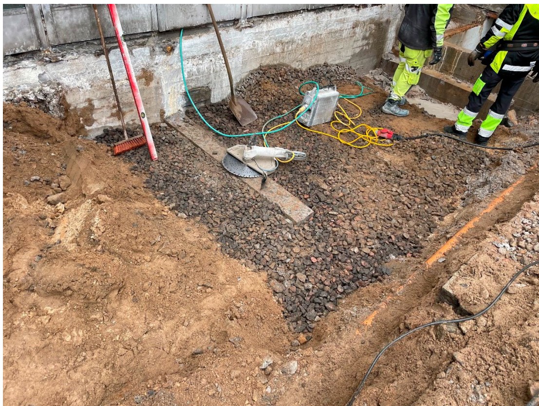
Figur 4. Foto av ytan under betongplattan. Foto mot NÖ.