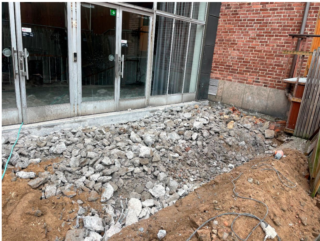
Figur 3. Foto av sönderbilade ytan. Foto mot Nö.