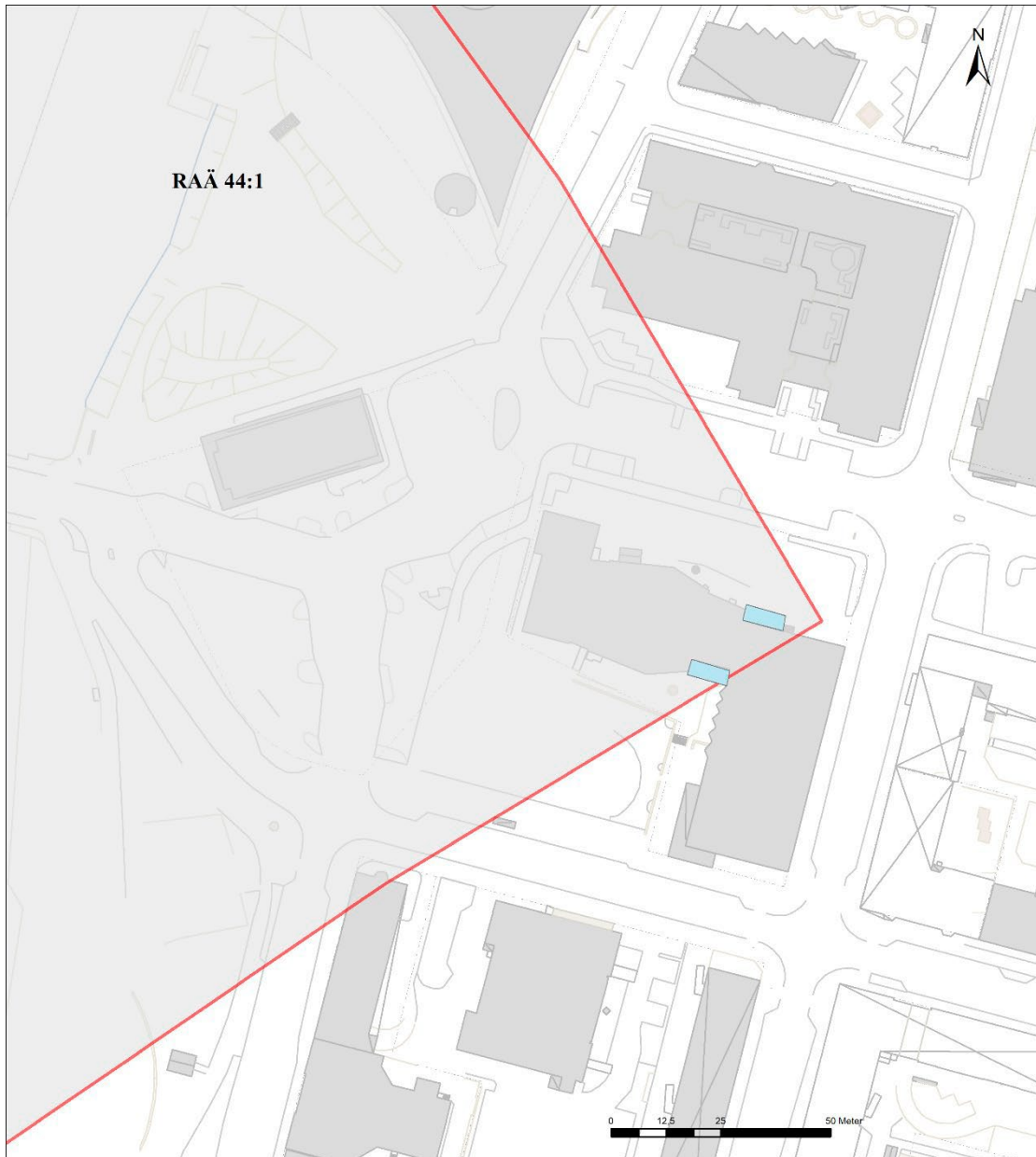
Figur 2. Undersökningsområden i blått. Skala 1:1000.